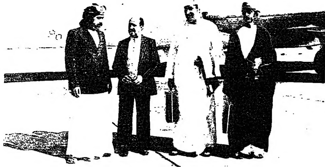
الفردلدى مفارته مطار السبيل الدولي وفي وداعهم سعادة السفير اليمني